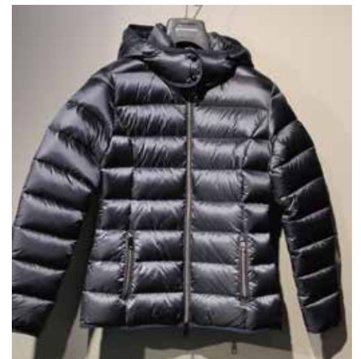
cod. 12550 art. STELLA ENTER MODEL ¥ 39,000 氷点下10°C対応