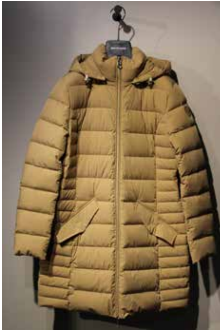
cod. 12578 art. MARUJA ¥ 65,000 STRETCH NYLON 氷点下10°C対応