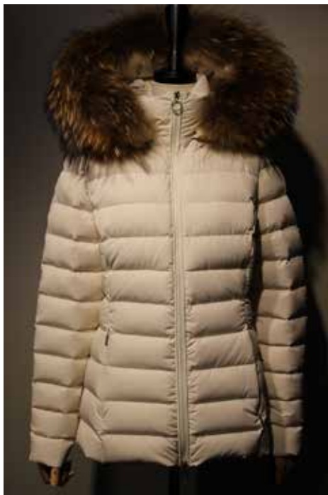
cod. 12576 art. SALTA MURMASKY ¥ 59,000 STRETCH NYLON 氷点下10°C対応