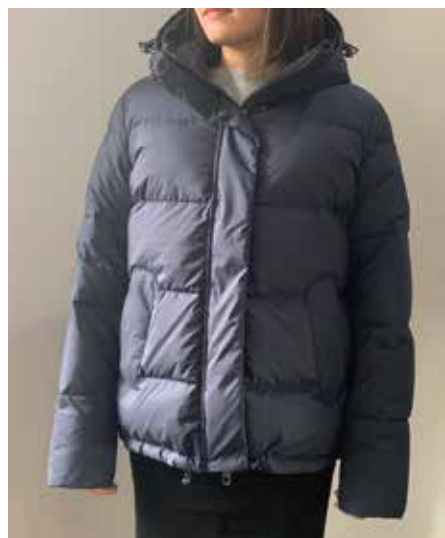
cod. 12569 art. MATT SENDERO ¥ 49,000 MATT FABRIC 氷点下10°C対応