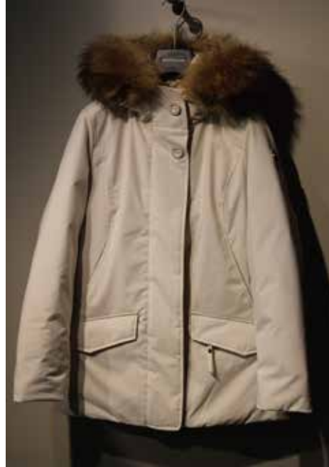
cod. 12500 art. NEVADO MURMASKY 氷点下25°C対応 ¥ 89,000 POLYTECH